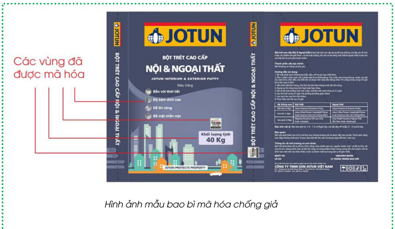
Hình ảnh mẫu bao bì mã hóa chống giả